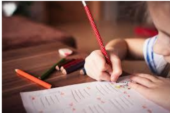
ECRIRE Novembre 2021