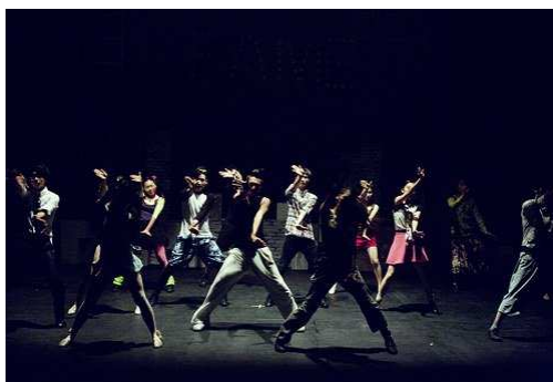
DANSER Octobre 2019